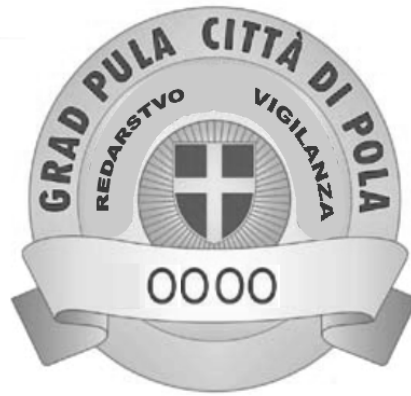
Prilog 1. Grafički izgled značke redara