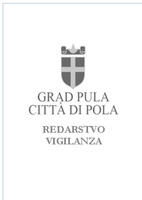
Prilog 2. Grafički izgled prednje strane kožnog poveza