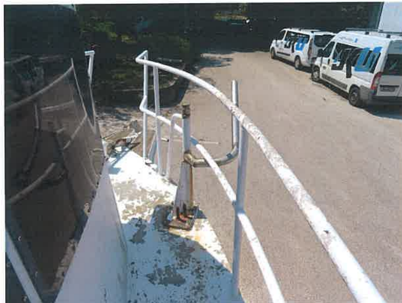
Slika 4: Ukraden puretić – vitlo za podizanje mreža