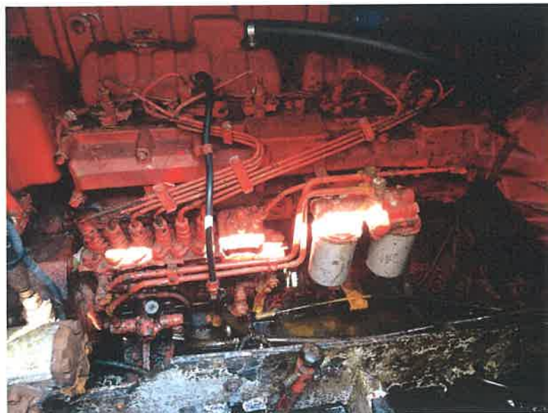
Slika 3: Pogonski stroj