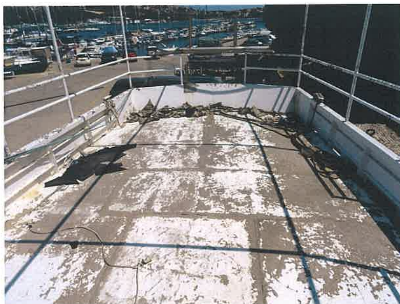
Slika 1: Prostor krme – radni prostor