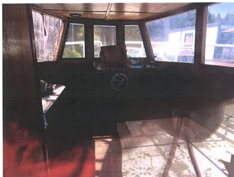
Slka 2: Kormilarnica u sklopu kabine