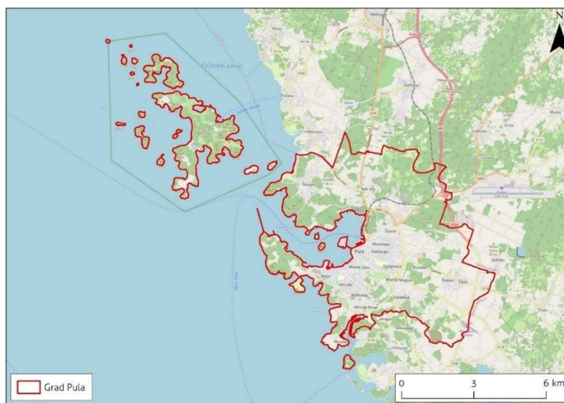
Slika 1. Prostorni obuhvat Grada Pule - Pola

Grad Pula-Pola smješten je na povoljnom geoprometnom području južnog dijela poluotoka Istre, točnije, prema fizionomskoj regionalizaciji Hrvatske (Magaš, 2013.), na prostornoj cjelini Jugozapadnog istarskog priobalja. Na sjeveru Pula graniči s Gradom Vodnjanom, na sjeverozapadu s Općinom Fažana, na istoku s Općinama Ližnjan i Marčana, a na jugu s općinom Medulin. Zapadna strana Grada smještena je tik uz Jadransko more, a unutar prostornog obuhvata nalazi se i Brijunsko otočje 1 , kao i nekolicina otočića i hrđi.