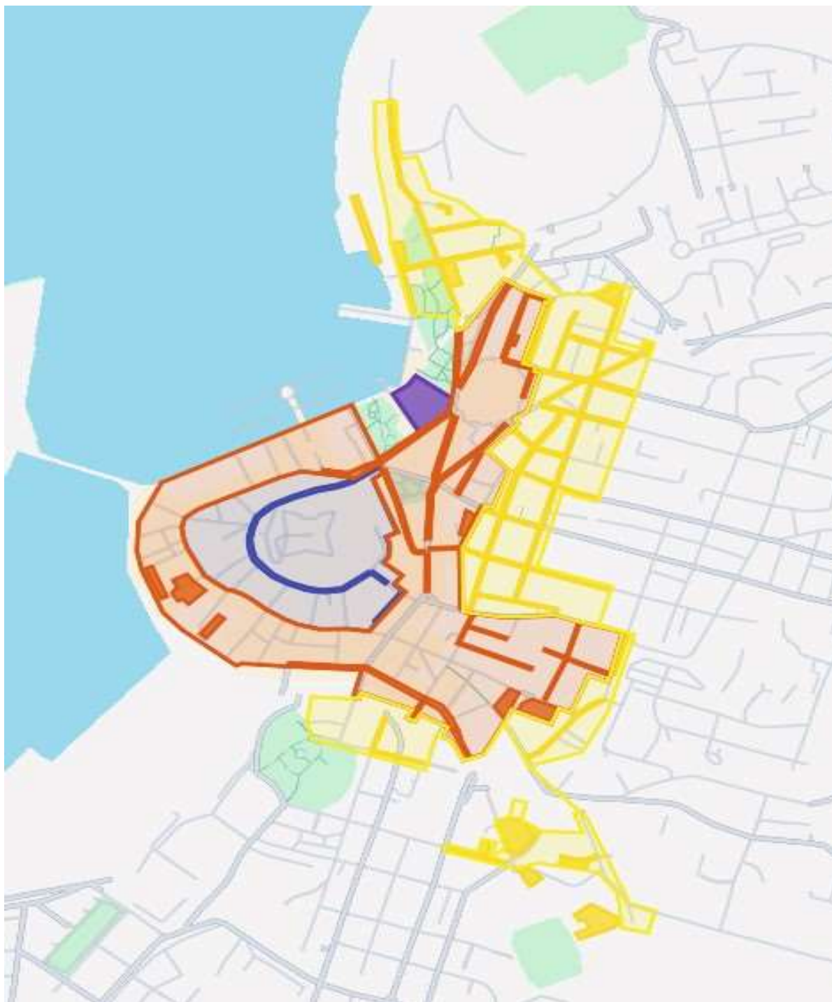
Grafički prikaz broj 1 sve zone