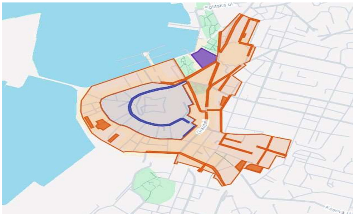
Grafički prikaz broj 3 2. zona