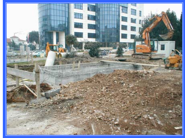
SLIKA: Radovi na Trgu Republike Faza I

Do 31.12.2006.godine ukupno je položeno 7.060 m 1 raznih cijevi, i to: za kolektor 4.589 m 1 , razne kanalizacijske cijevi za oborinsku kanalizaciju dužine 2.224 m 1 i za rekonstrukciju vodovodne mreže i priključka cijevi dužine 247 m 1 .