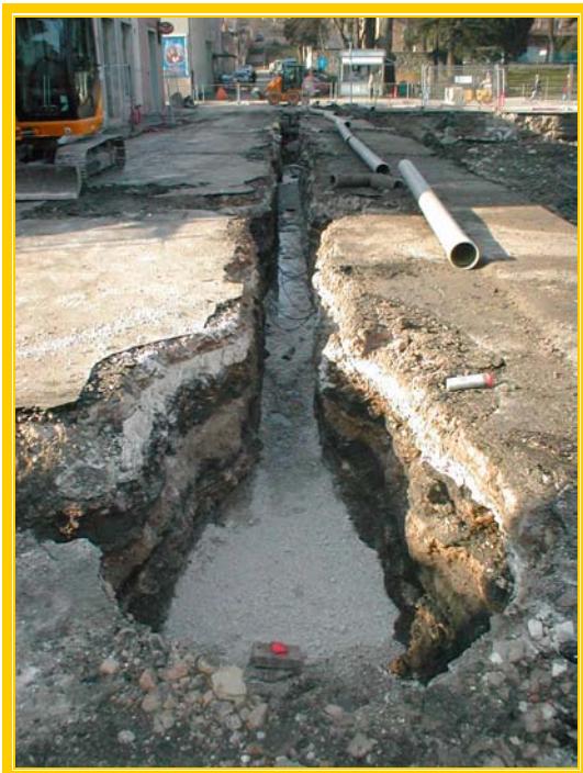
SLIKA: Rekonstrukcija Marulićeve ulice

Ostali troškovi poslovanja su manji za 3% od plana, a manji su 7% od prošle godine, i to: naknade troškova na rad i s rada su manje za 1%, ostale neproizvodne usluge OK Vodovod d.o.o za ubiranje naknade za kolektor od građana kroz račune vode su veći za 4%, troškovi reprezentacije su manji za 60%, premije osiguranja su veće za 9%, troškovi ostalih materijalnih prava radnika su manji za 4%, ostali nematerijalni troškovi su znatno manji i dr.