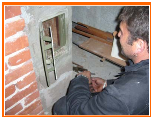
SLIKA: Odčeppljivanje dimovoda

Prekovremeni sati iznose 785 sati rada i manji su za 6% od istih sati prošle godine (836 sati).