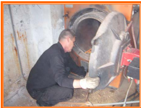
SLIKA: Čišćenje kotla za centralno grijanje

Ostali troškovi poslovanja su manji za 12% od prošle godine, a za 13% su manji od plana poslovanja, i to: u odnosu na 2005. godinu naknade troškova prijevoza radnika na rad i s rada su manje za 6% (smanjio se broj radnika za 1 dimnjačara), zdravstvene usluge su veće za 7% (periodični sistematski pregledi), premije osiguranja imovine i radnika su manje za 21%, doprinos fondu za staž s uvećanim trajanjem je manji za 8% i troškovi ostalih materijalnih prava radnika po važećem Kolektivnom ugovoru su manji za 51%.