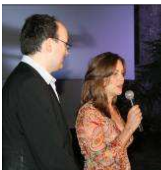
Program Europolis-Meridijani na Kaštelu otvorila je Greta Scacchi.

Festivalskoj atmosferi uvelike su pridonijeli popratni programi PulaFilmFactory, Cinemania[c], Mala filmska škola profesora Baltazara i 640x480max.